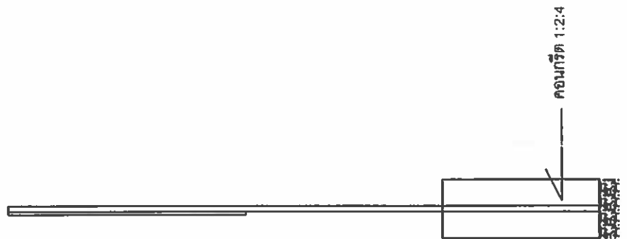
รูปด้านข้าง 1:25